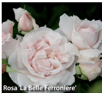
Rosa 'La Belle Ferroniere'

Jardinez et détendez-vous dans un jardin qui vous ressemble !