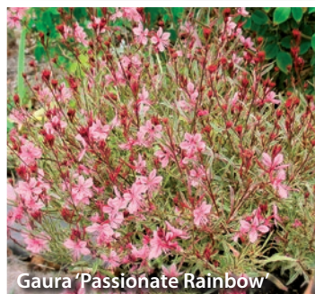
Gaura 'Passionate Rainbow'