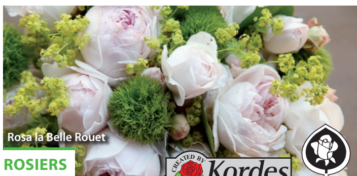
Rosa la Belle Rouet

Découvrez notre sélection de grimpantes Globe Planter (clématite, chèvrefeuille, jasmin) pour agrémenter les surfaces verticales extérieures (pergolas, clôtures). Leur floraison abondante et feuillage ornemental magnifieront votre jardin et vos potées tout en occupant qu'une faible surface au sol.