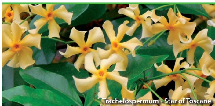
Trachelospermum - Star of Toscane

Retrouvez également nos petits fruitiers (groseiller, goji, framboisier). Et découvrez plus de 50 références de graines biologiques produites par la ferme de Sainte Marthe !