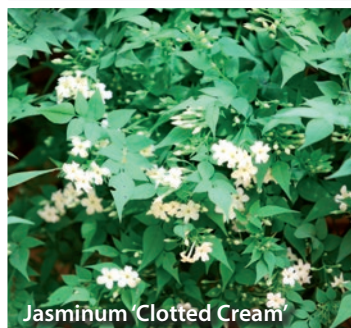
Jasminum 'Clotted Cream'