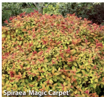
Spiraea 'Magic Carpet'