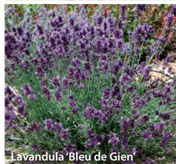
Lavandula 'Bleu de Gien'