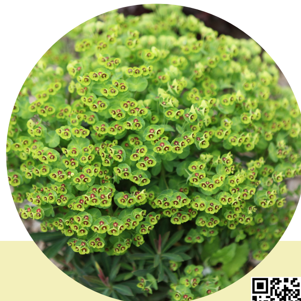
Walberton's® Tiny Tim