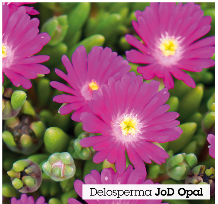
Delosperma JoD Opal