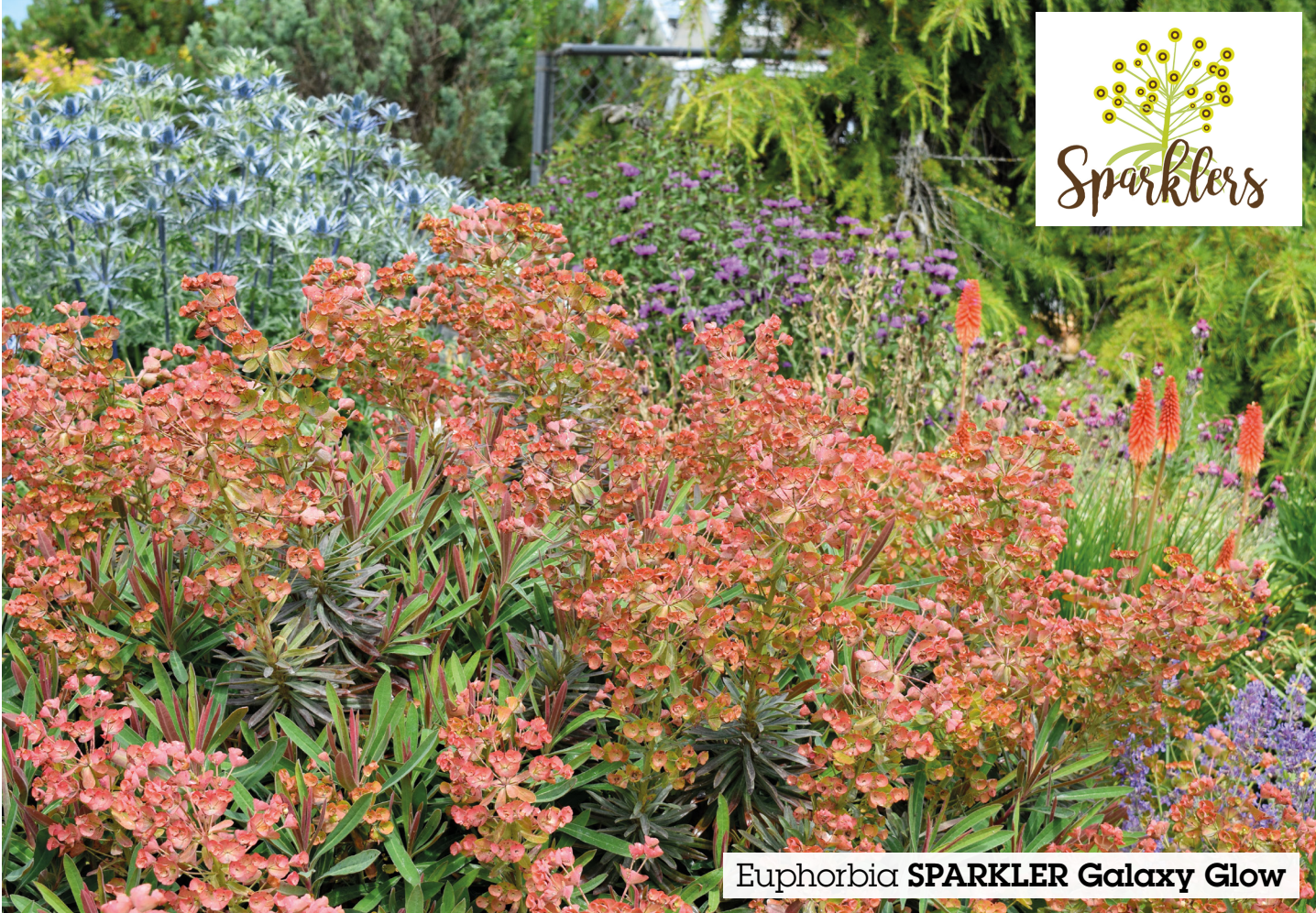
Euphorbia SPARKLER Galaxy Glow