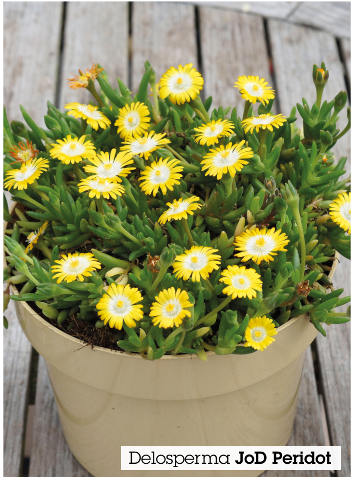
Delosperma JoD Peridot