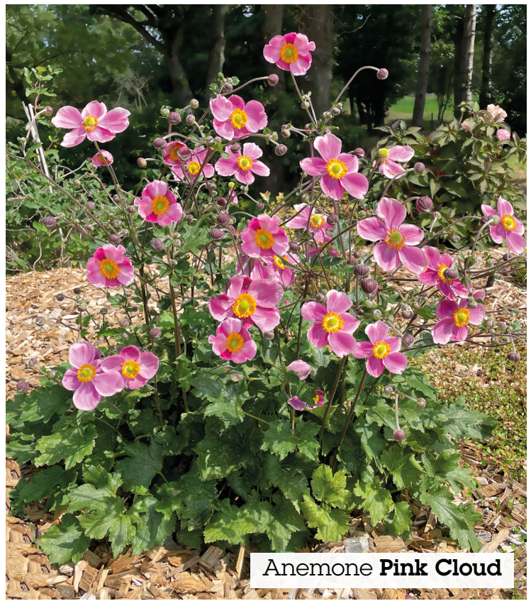
Anemone Pink Cloud