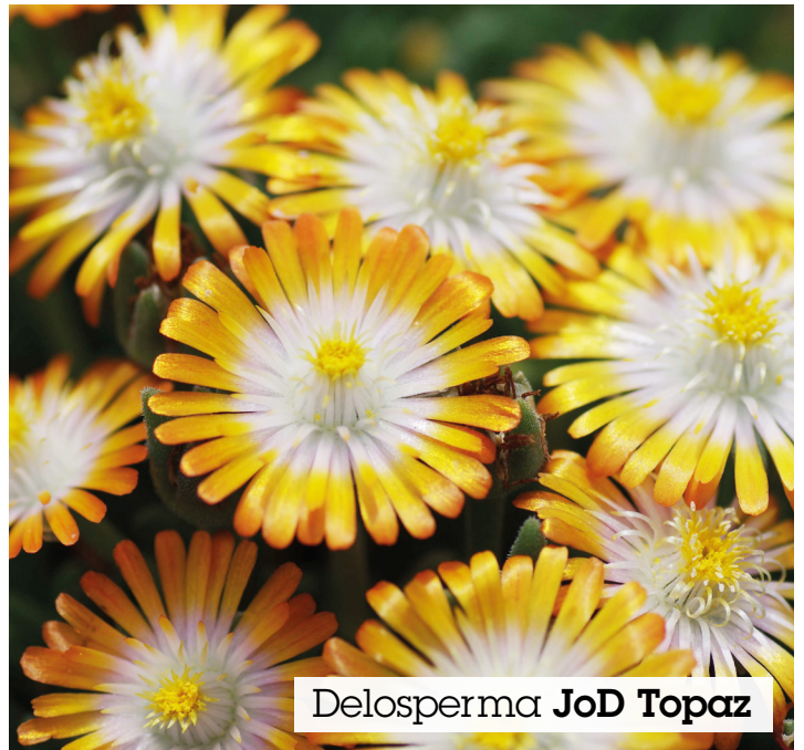
Delosperma JoD Topaz