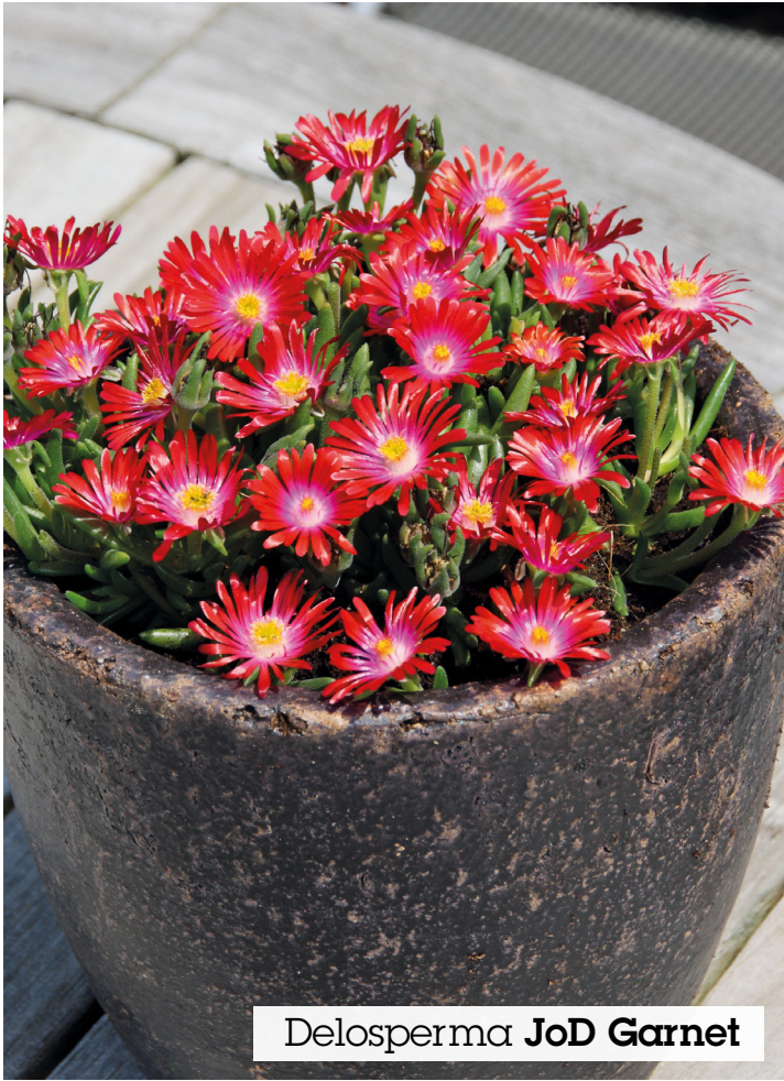
Delosperma JoD Garnet