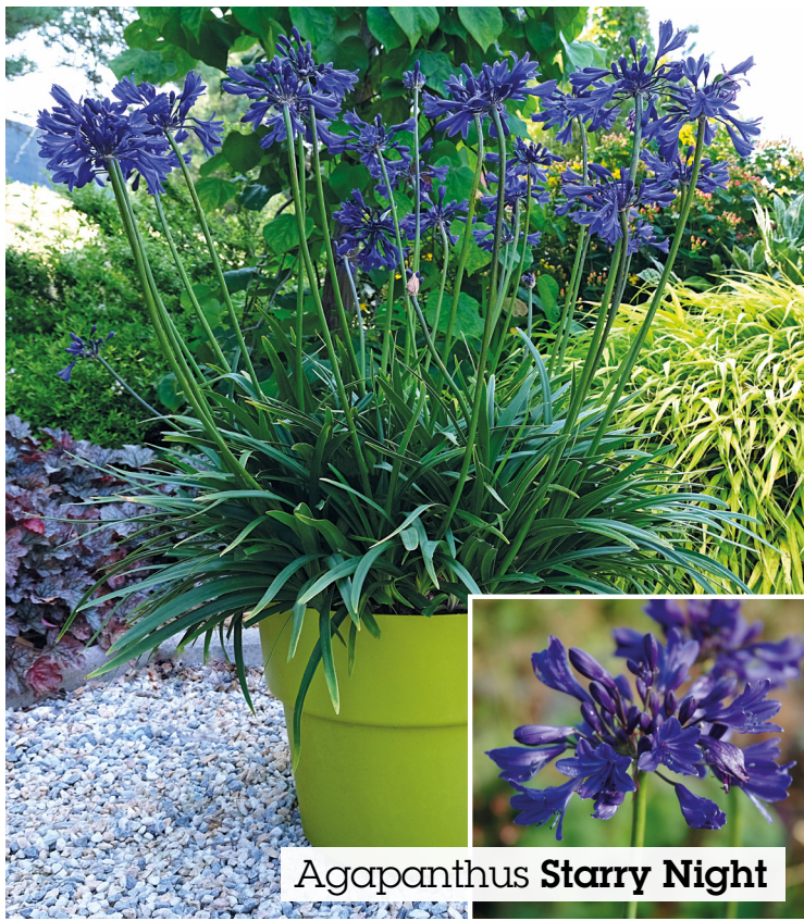
Agapanthus Starry Night