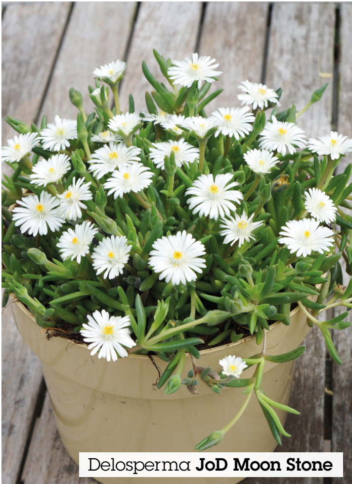
Delosperma JoD Moon Stone