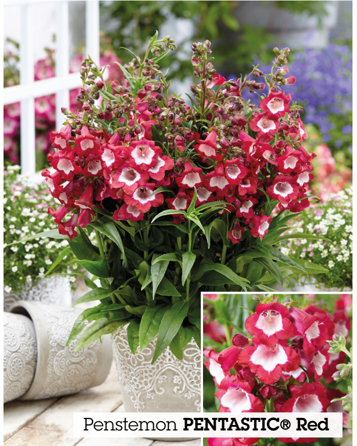
Penstemon PENTASTIC® Red