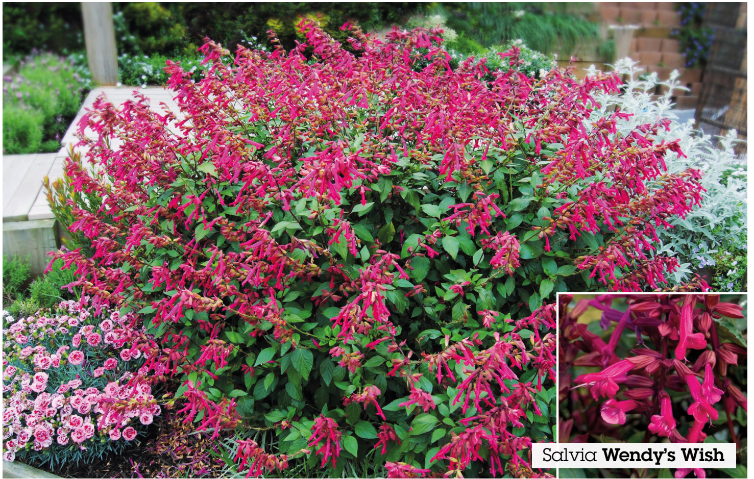
Salvia Wendy's Wish