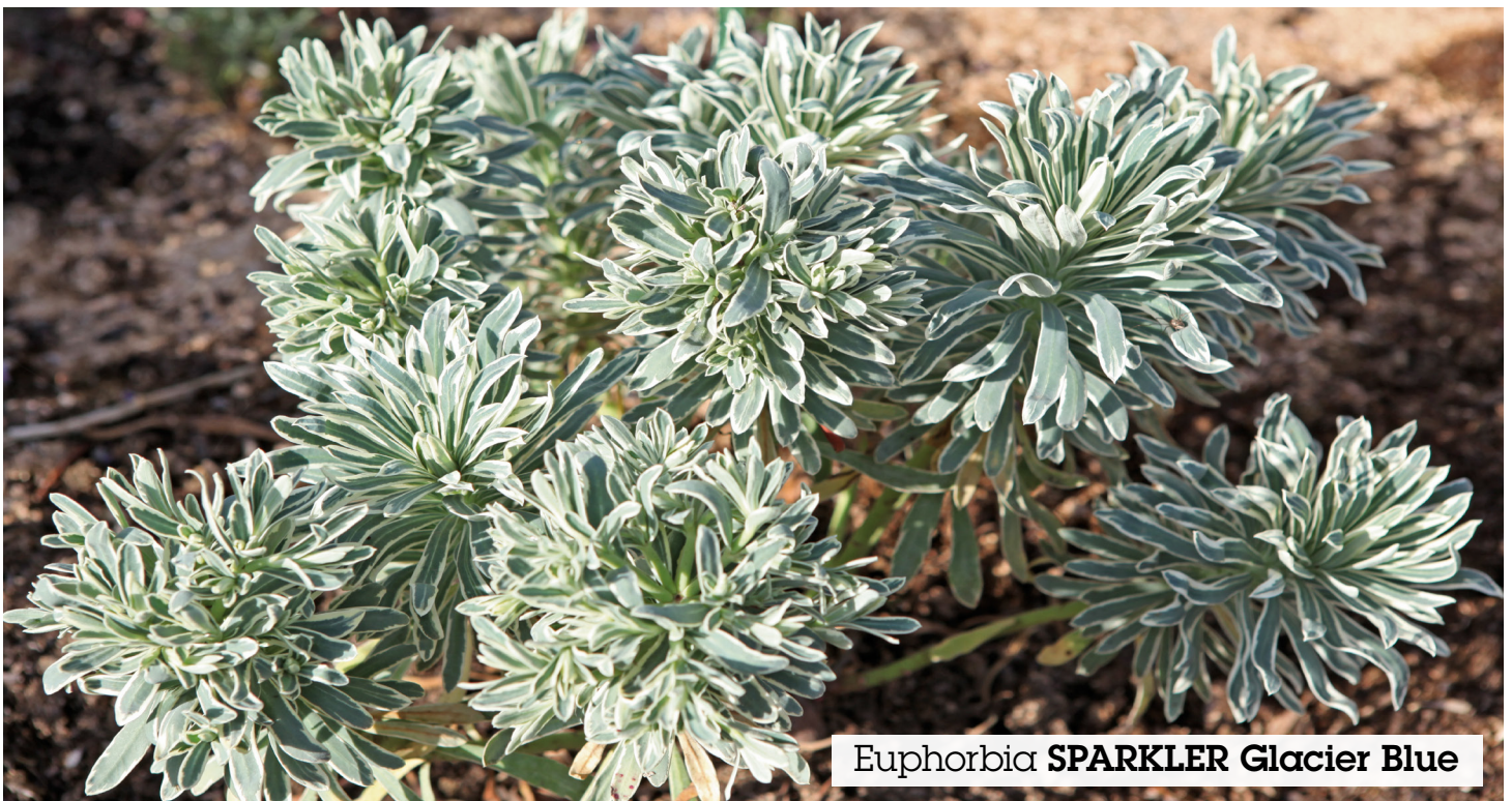
Euphorbia SPARKLER Glacier Blue