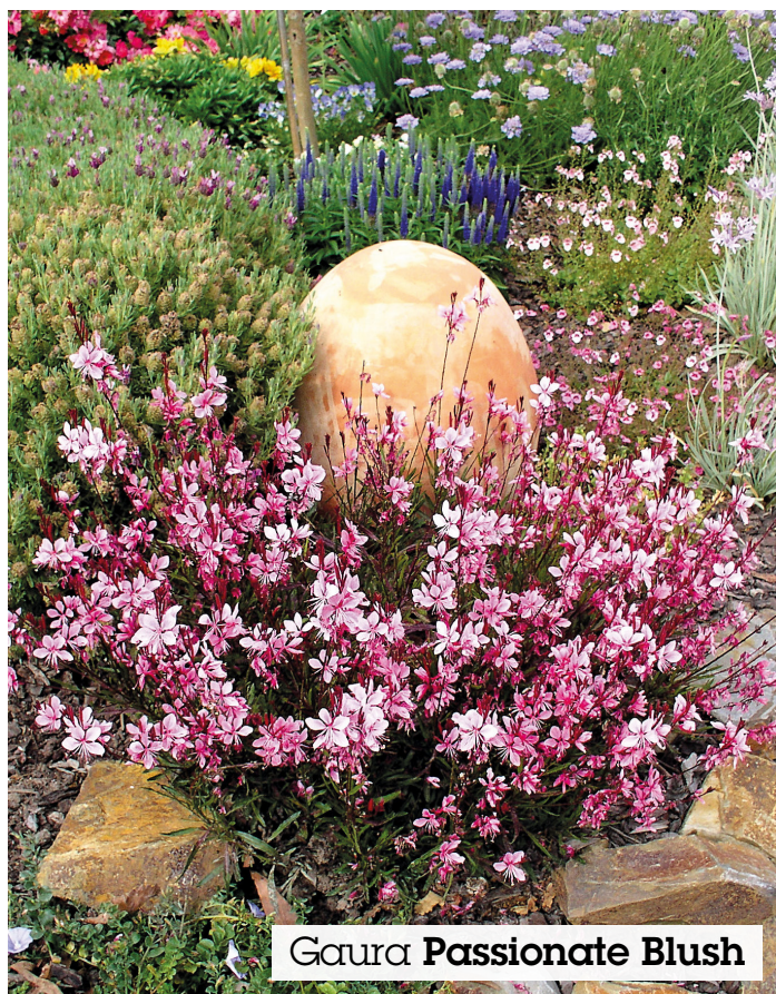
Gaura Passionate Blush