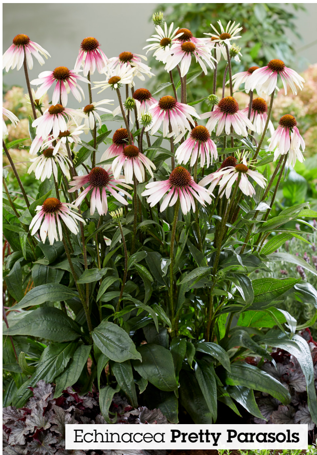
Echinacea Pretty Parasols