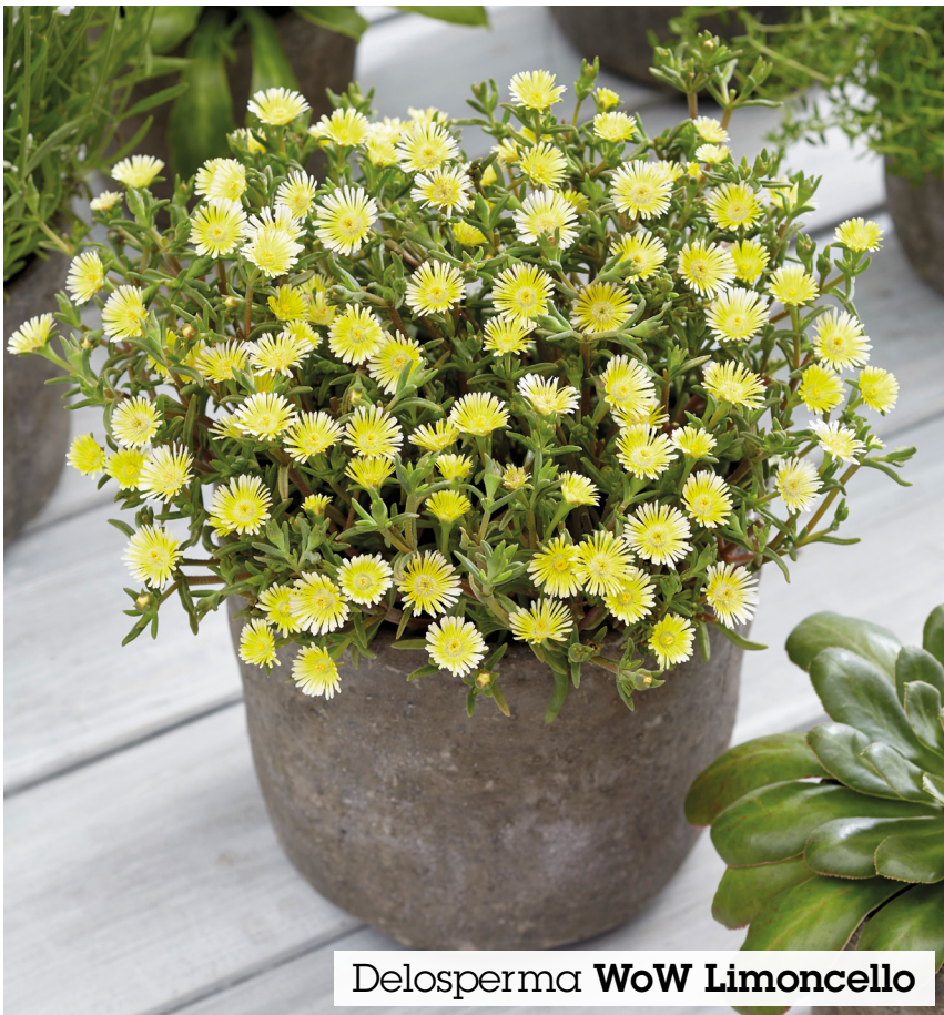
Delosperma WoW Limoncello