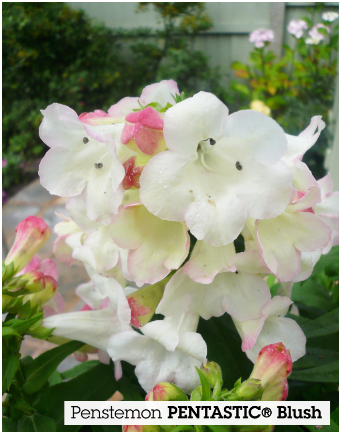
Penstemon PENTASTIC® Blush