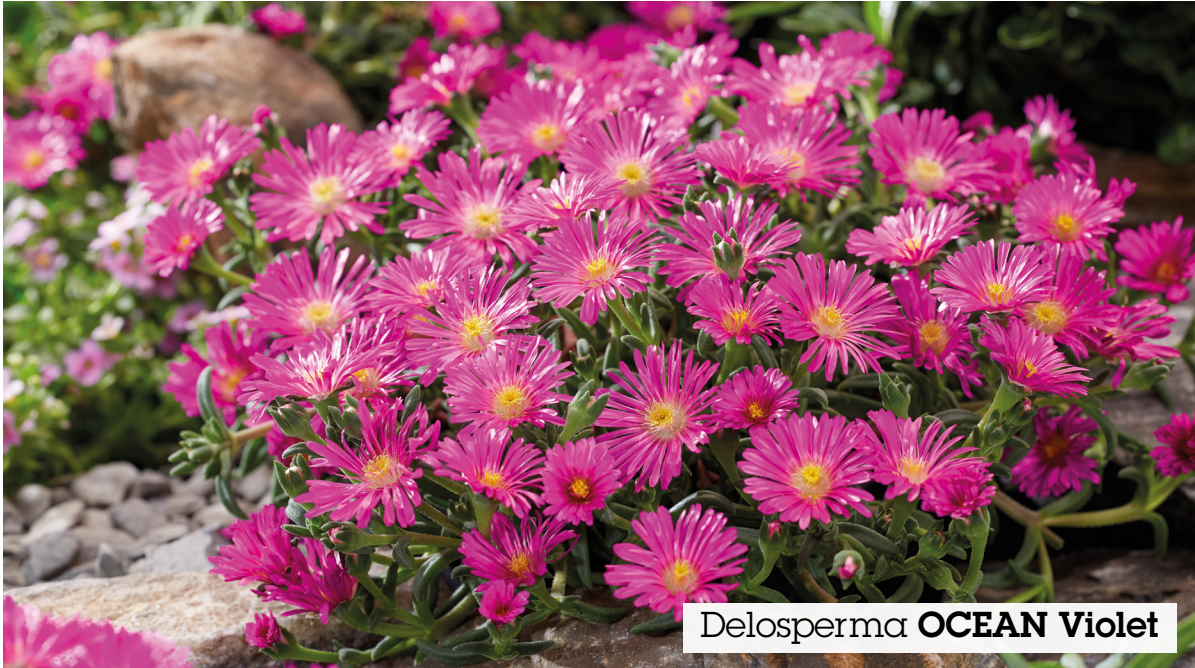
Delosperma OCEAN Violet