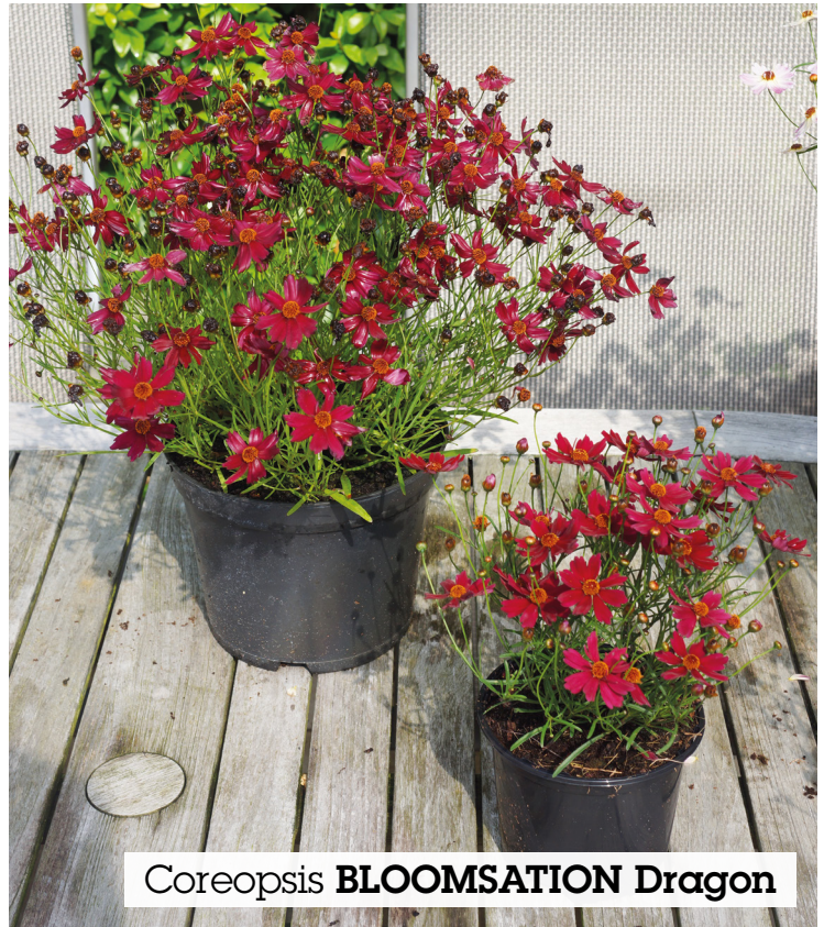
Coreopsis BLOOMSATION Dragon