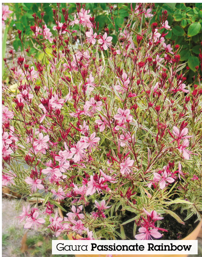
Gaura Passionate Rainbow