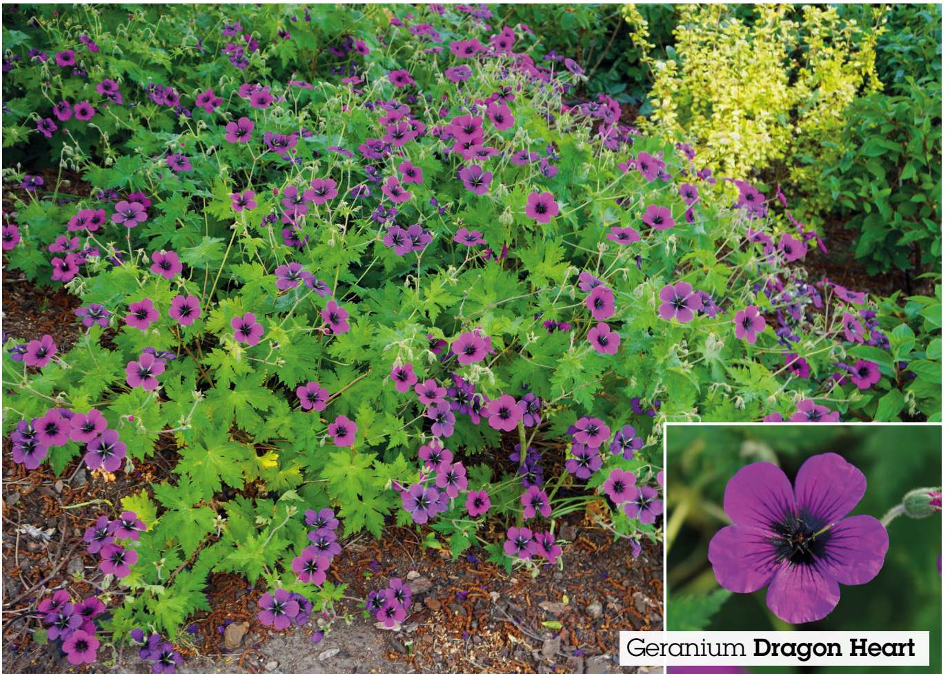
Geranium Dragon Heart