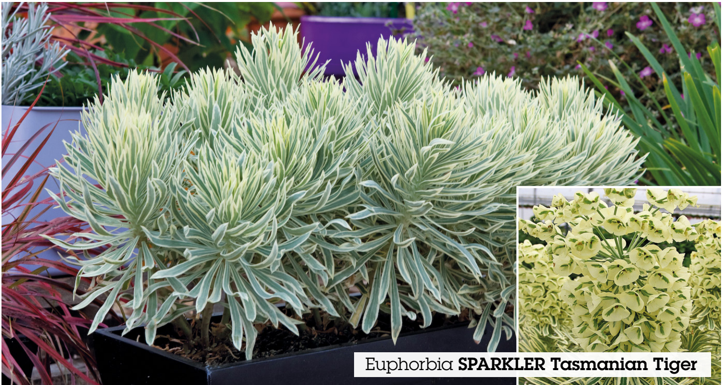
Euphorbia SPARKLER Tasmanian Tiger