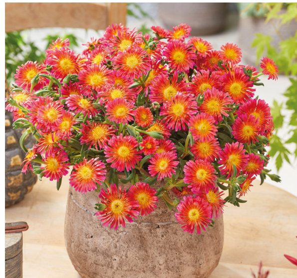
Delosperma OCEAN Orange Glow