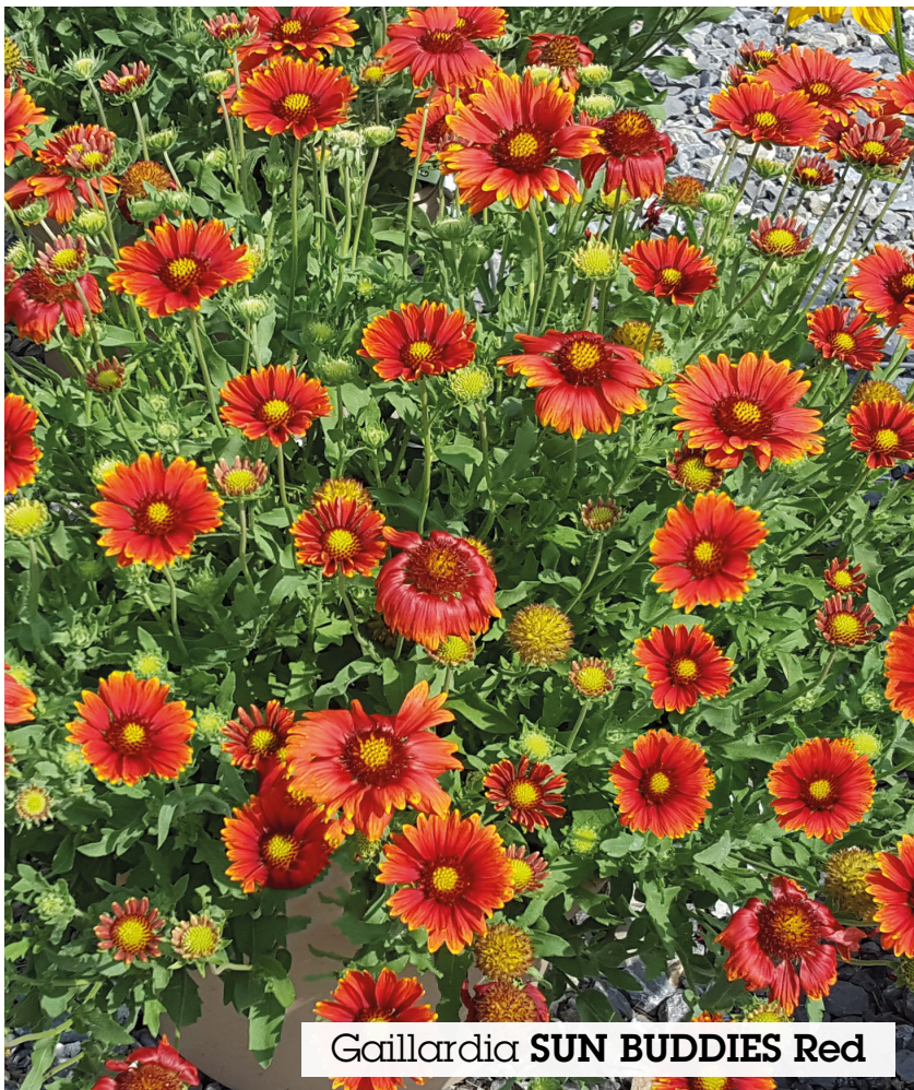
Gaillardia SUN BUDDIES Red