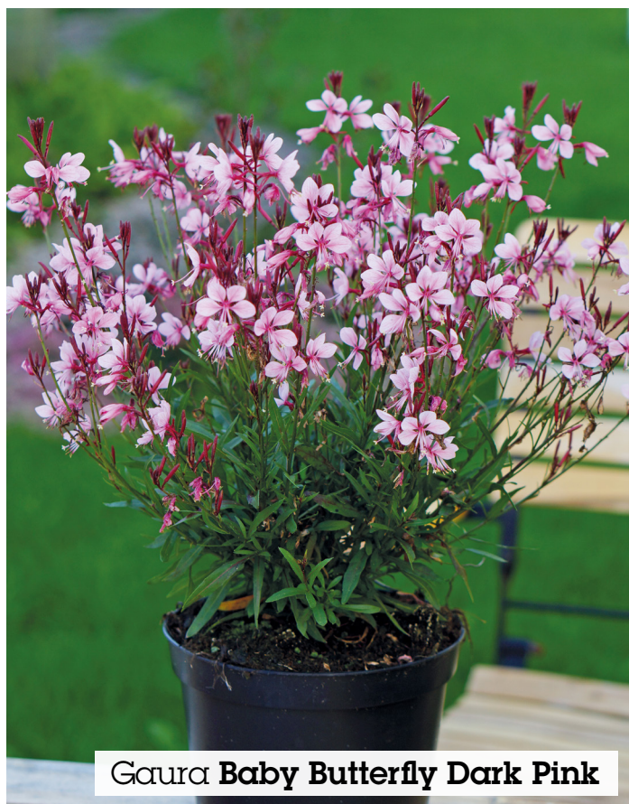
Gaura Baby Butterfly Dark Pink