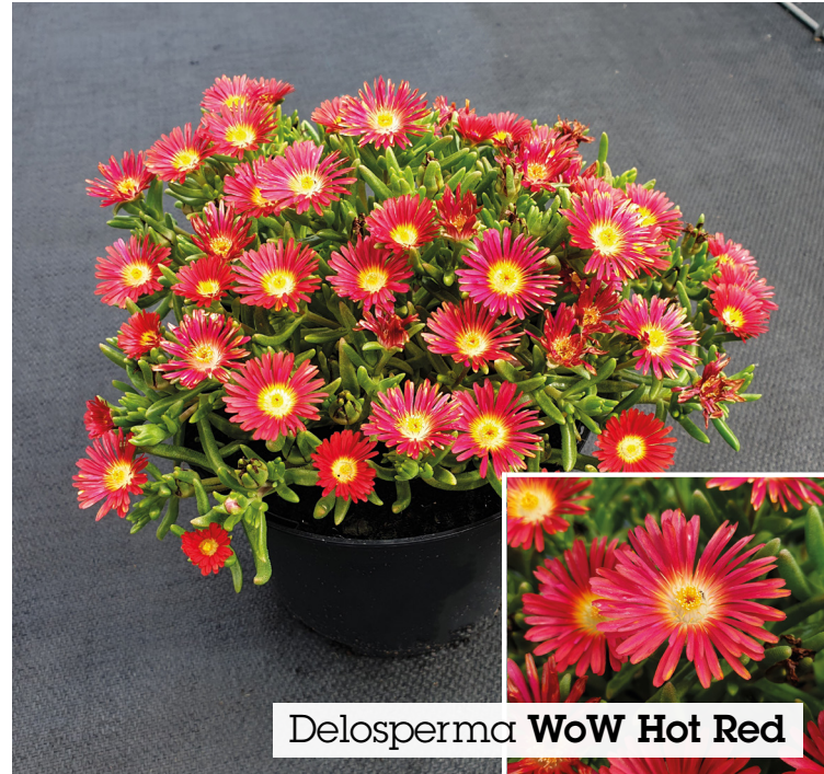
Delosperma WoW Hot Red