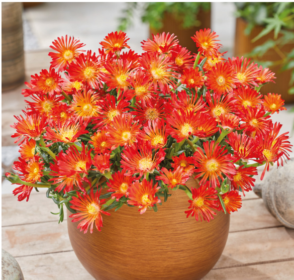
Delosperma OCEAN Orange Vibe