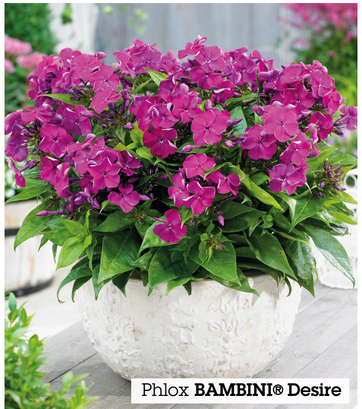
Phlox BAMBINI® Desire