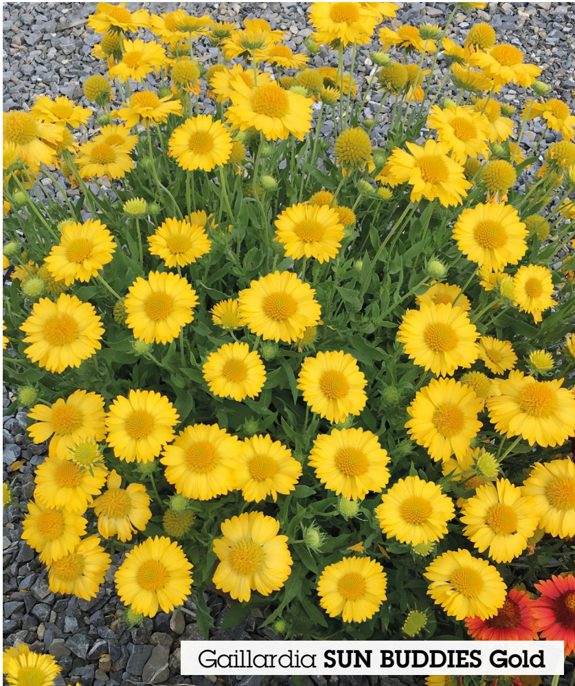
Gaillardia SUN BUDDIES Gold