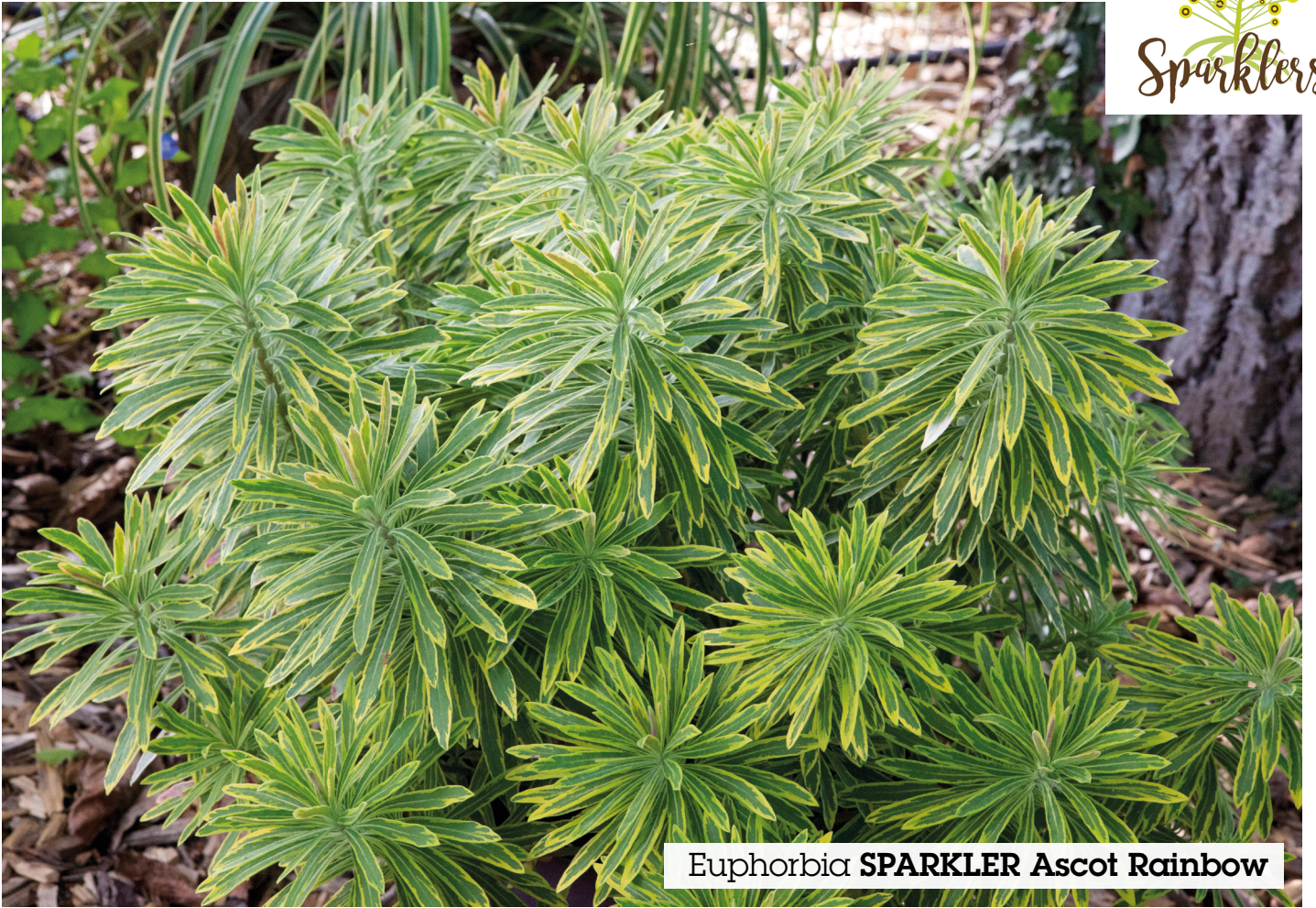
Euphorbia SPARKLER Ascot Rainbow