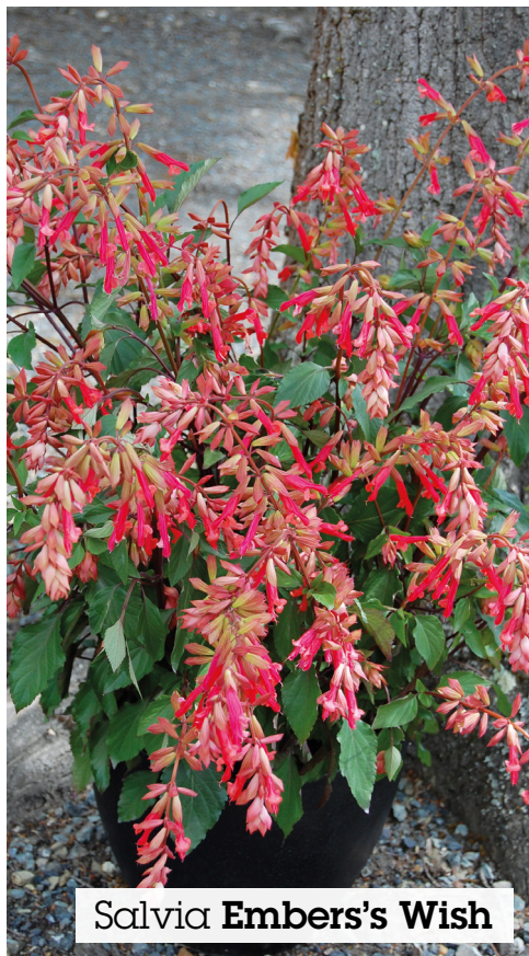
Salvia Embers's Wish