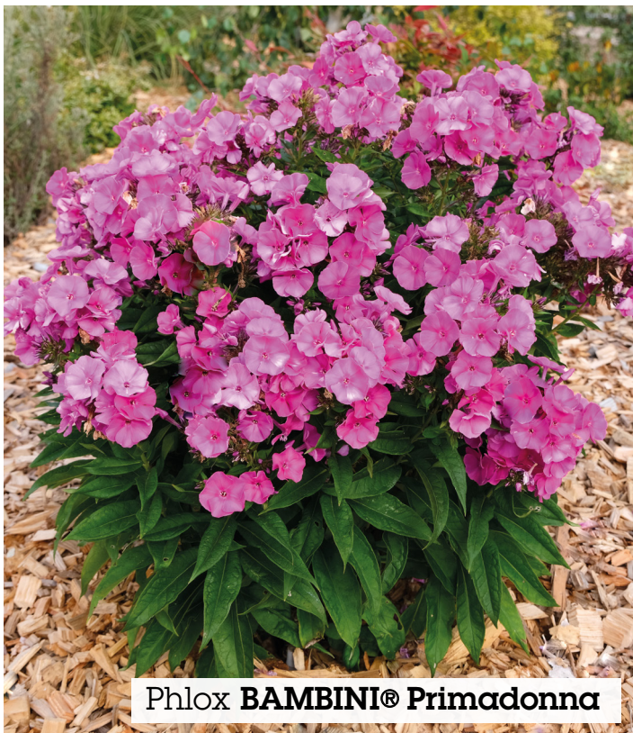
Phlox BAMBINI® Primadonna