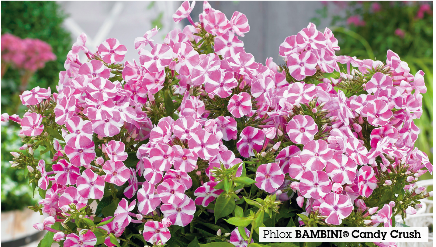
Phlox BAMBINI® Candy Crush