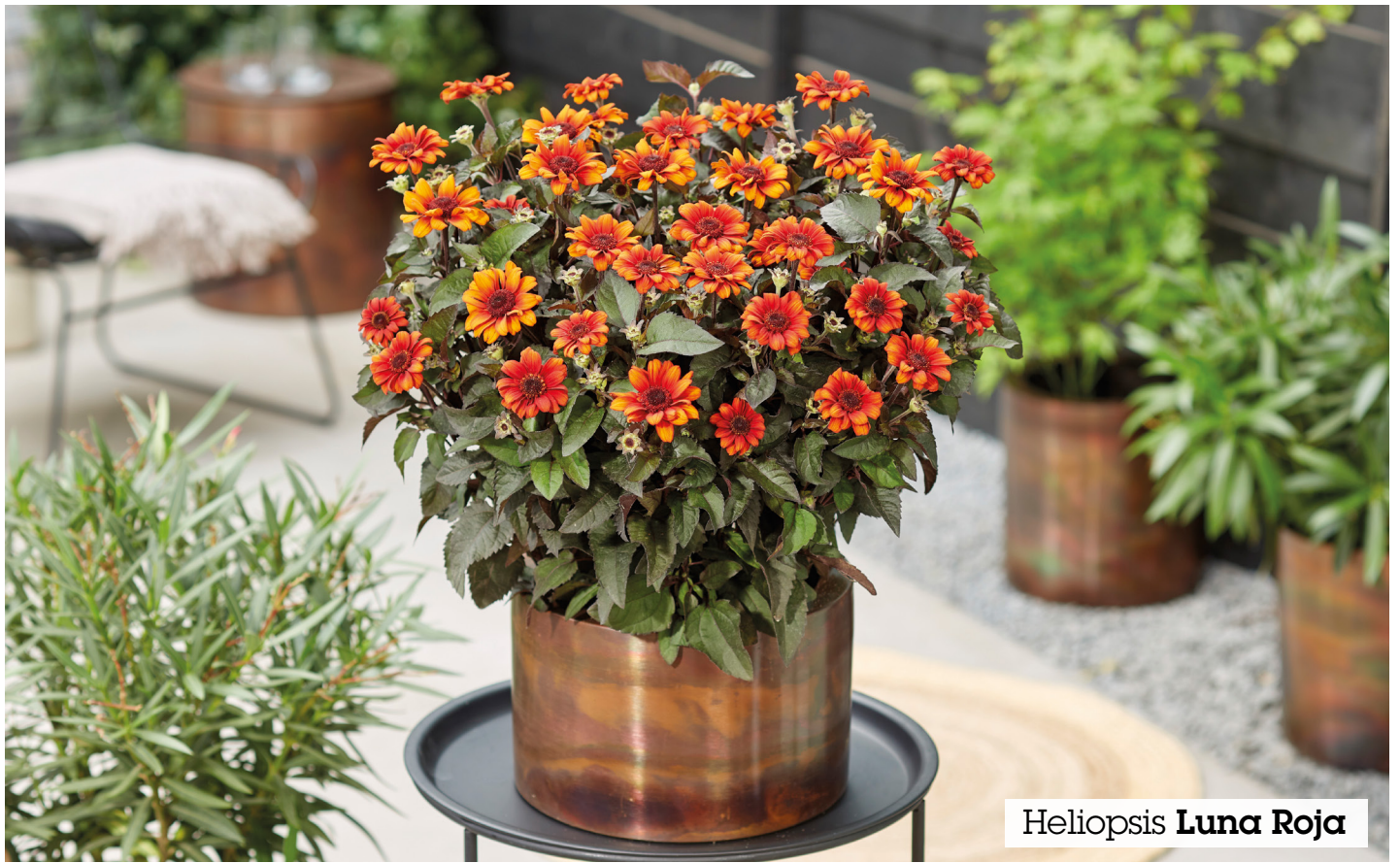
Heliopsis Luna Roja