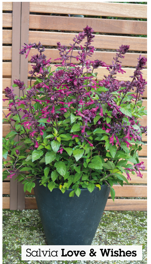
Salvia Love & Wishes