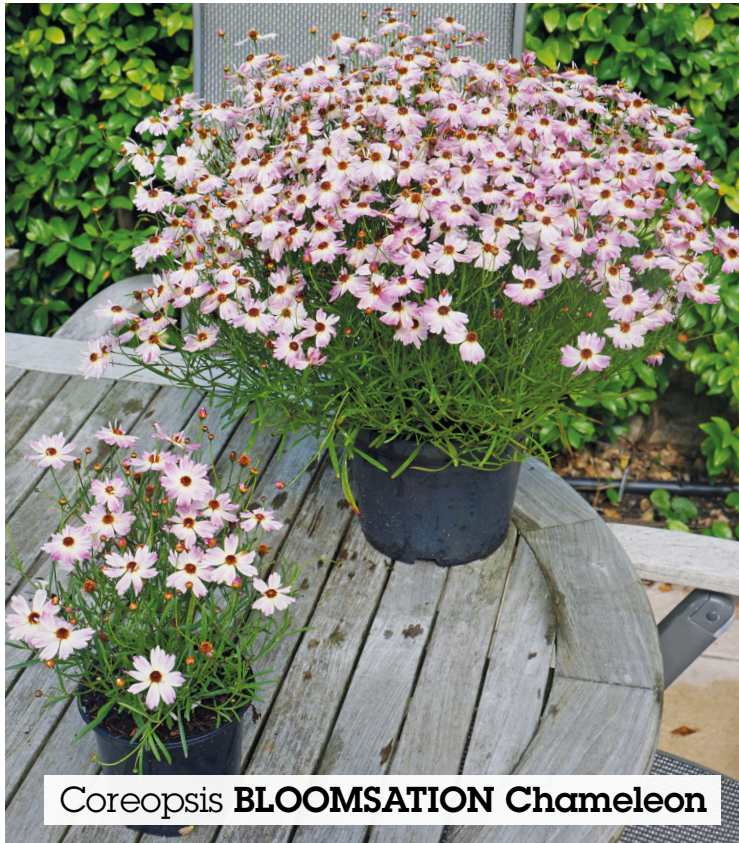
Coreopsis BLOOMSATION Chameleon