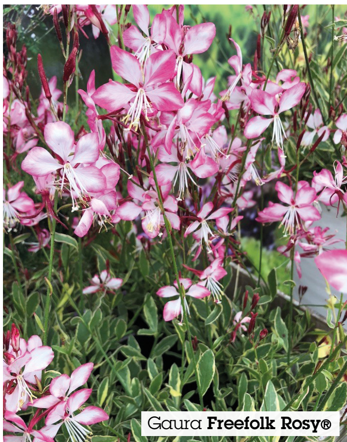
Gaura Freefolk Rosy®