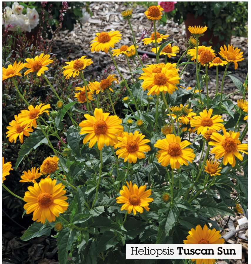
Heliopsis Tuscan Sun