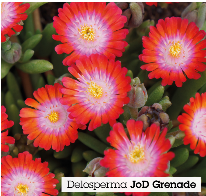
Delosperma JoD Grenade