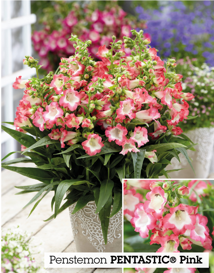
Penstemon PENTASTIC® Pink