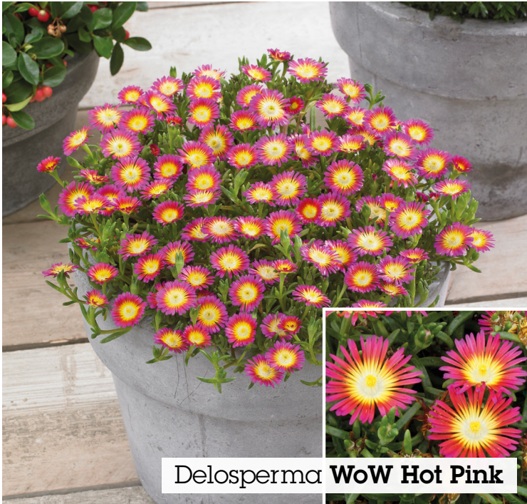
Delosperma WoW Hot Pink