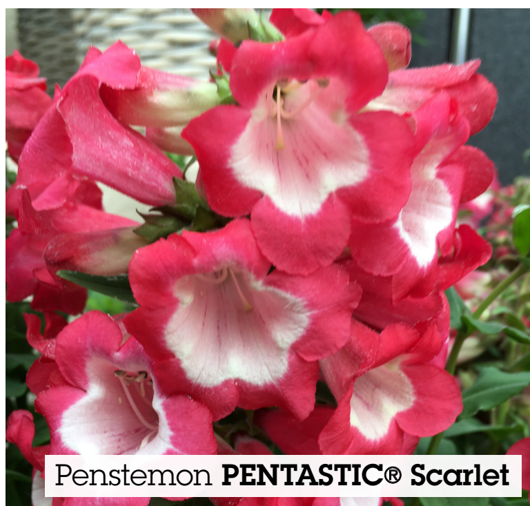
Penstemon PENTASTIC® Scarlet