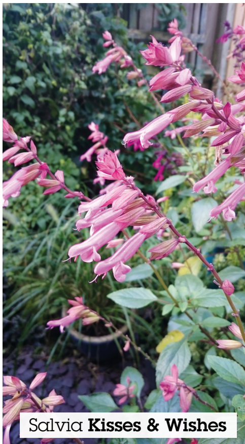
Salvia Kisses & Wishes