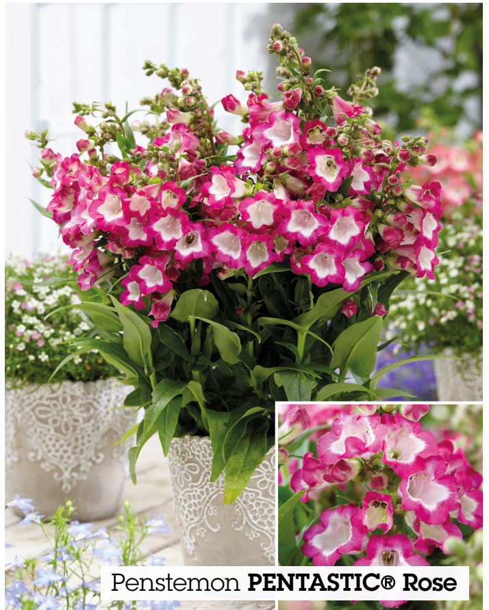
Penstemon PENTASTIC® Rose