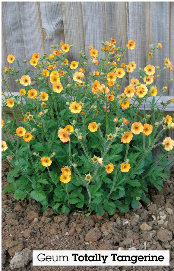
Geum Totally Tangerine