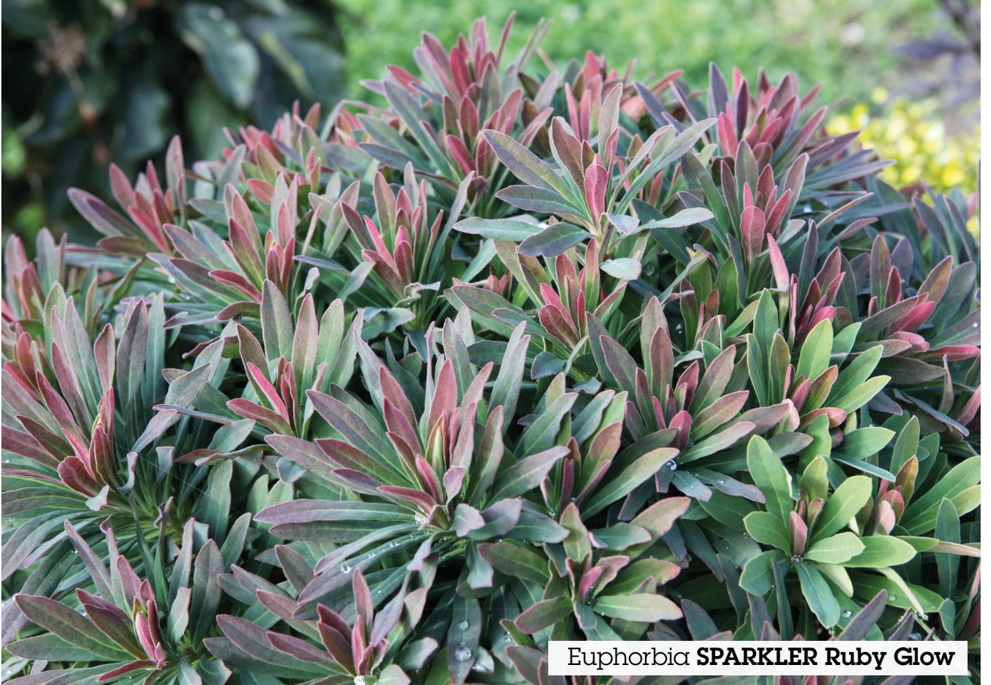
Euphorbia SPARKLER Ruby Glow