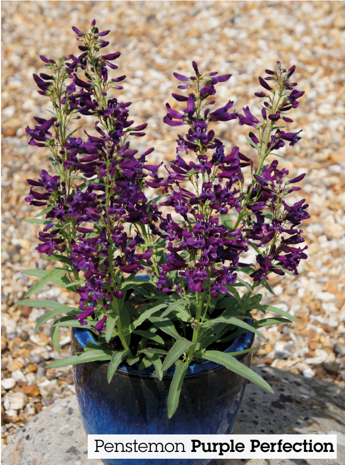
Penstemon Purple Perfection