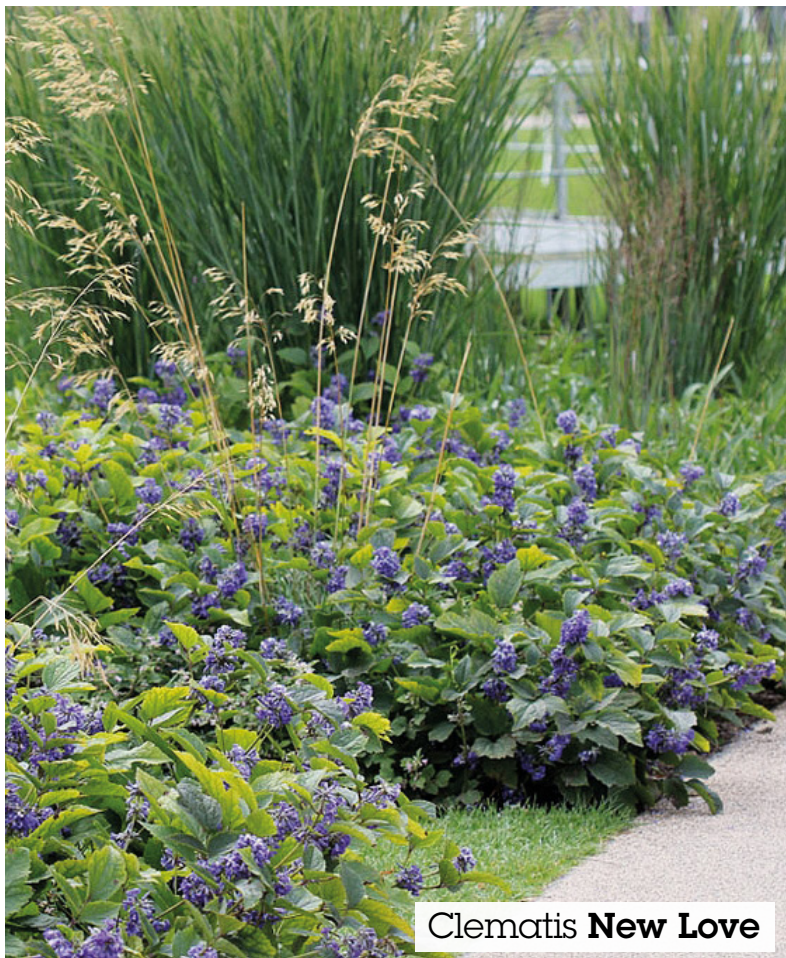
Clematis New Love