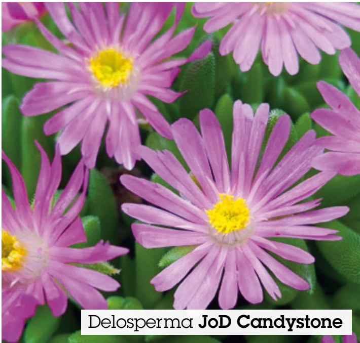
Delosperma JoD Candystone