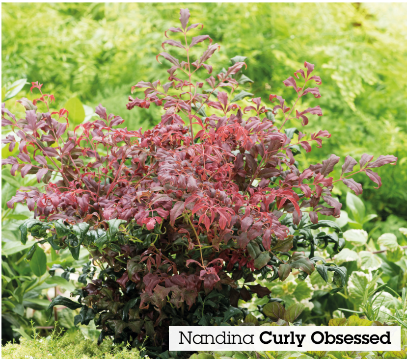
Nandina Curly Obsessed