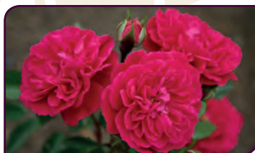
Rosa hybride ROXY® Tapis de roses ...