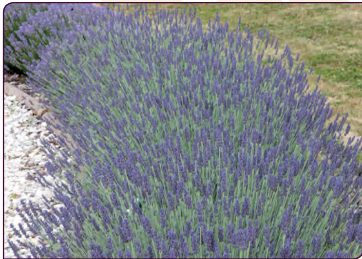
Lavandula lanata x angustifolia QUICKSILVER® Saphirs dans un écrin d'argent !