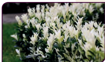
Euonymus Japonicus PALOMA BLANCA Jeunes pousses blanches