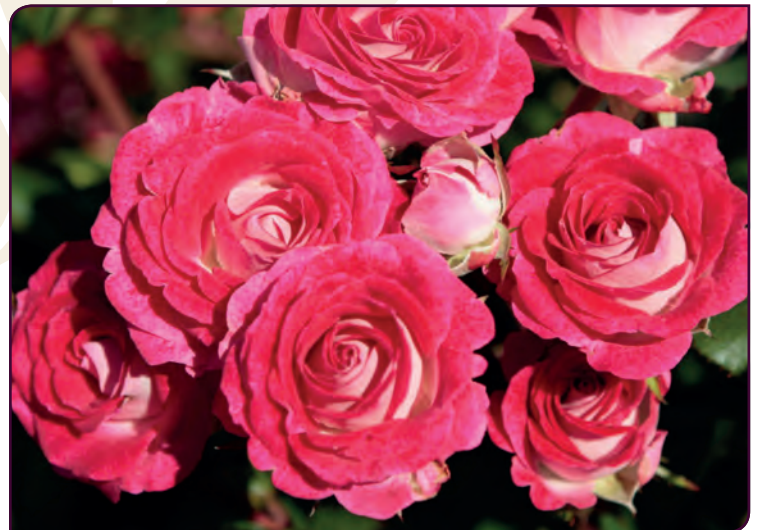
Rosa hybride ANNE ROUMANOFF® Lumineux, compact, florifère