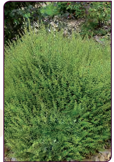
Lonicera nitida TIDY TIPS Idéal pour les formes topiaires