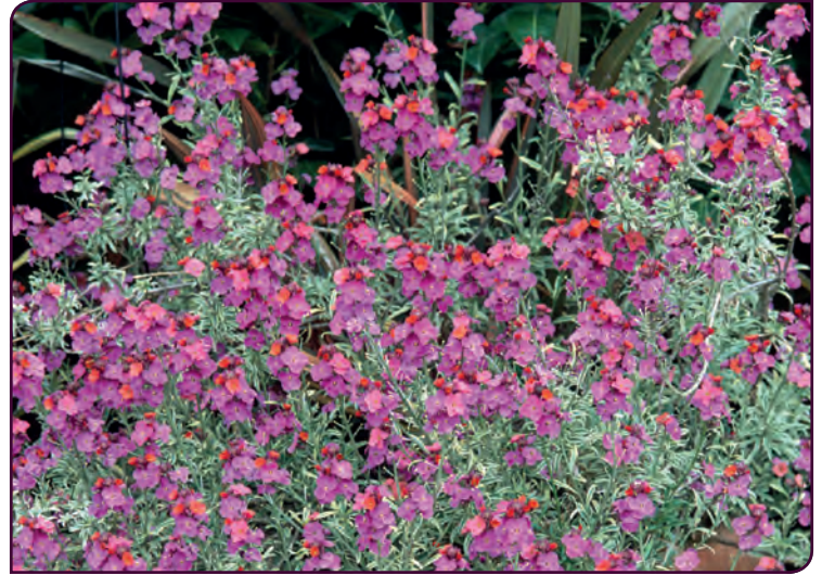
Erysimum linifolium STAR'N STRIPES Plante élégante et solide !