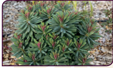
Euphorbia x martini WALBERTON'S® TINY TIM Petite boule en toute saison !