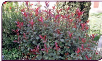
Photinia fraseri CORALLINA® Plume rouge toute l'année