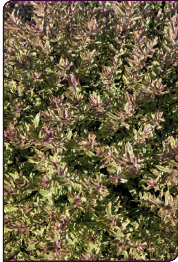
Hebe hybride PURPLE SHAMROCK Change de couleur selon la température...