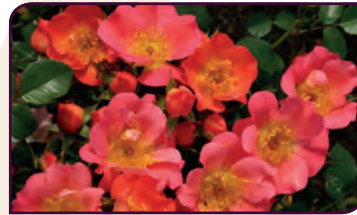
Rosa hybride COCO® Toujours en fleurs !