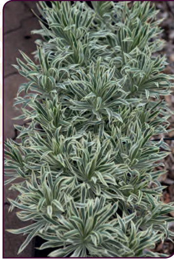
Euphorbia characias TASMANIAN TIGER Déco permanente !