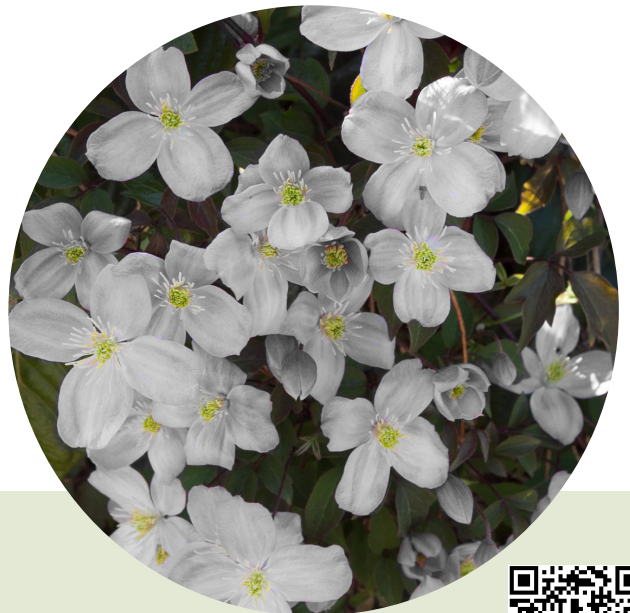
White Giant Star