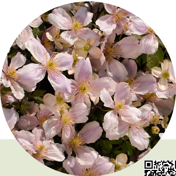
Pink Giant Star