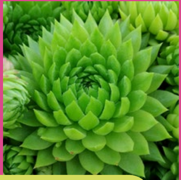
Key Lime Kiss