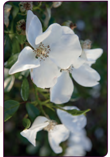
Rosa hybride ESCIMO® Élégant et satiné !