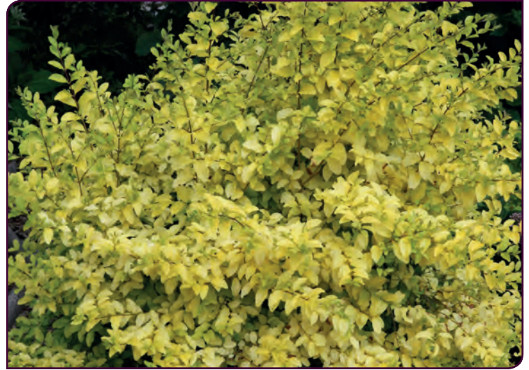
Ligustrum sinensis LEMON & LIME Robuste buisson couleur citron !