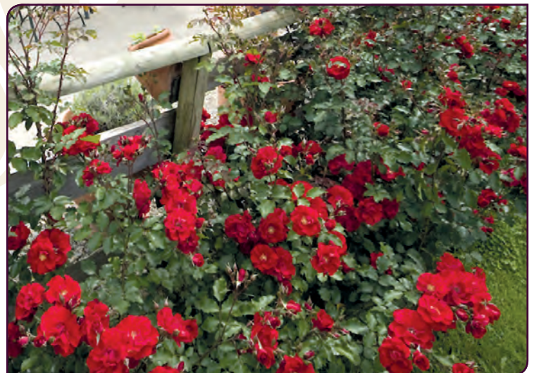
Rosa hybride VITTEL Sa fleur s'épanouit pendant 3 semaines ...