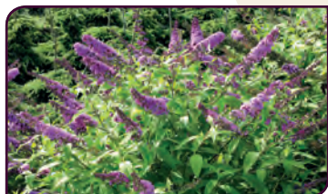
Buddleja davidii MOONSHINE Attire les papillons