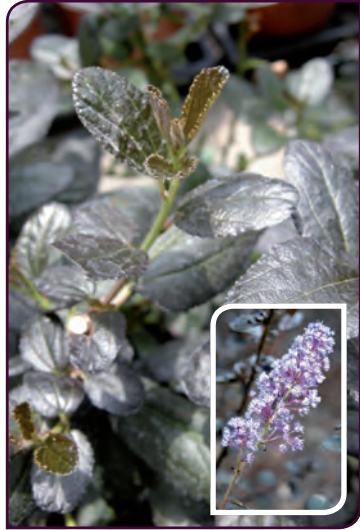
Caenothus thyrsiflorus TUXEDO Noire et bleue ...