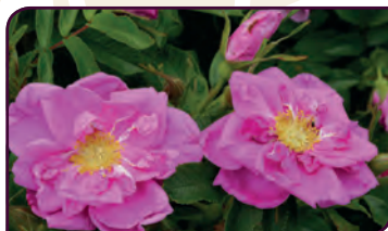
Rosa hybride SMART ROADRUNNER® Embaumement total !