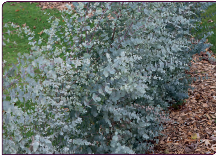
Eucalyptus gunnii AZURA Magie bleue !