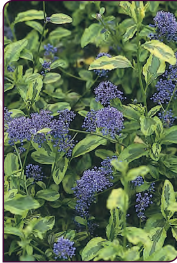
Caenothus thyrsiflorus EL DORADO Vigoureuse et lumineuse !