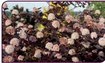
Physocarpus opulifolius LADY IN RED Lumière rouge